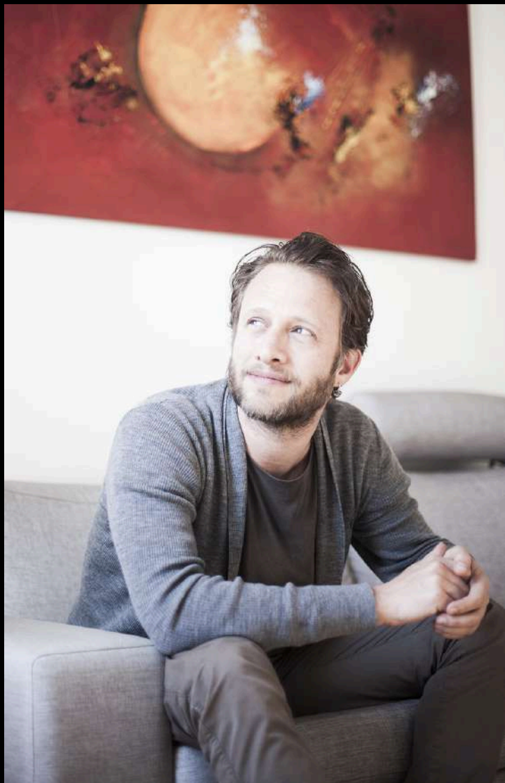
FEDERICO JUSID Zuzendaria

Musikari emankorra eta eklektikoa (konpositorea, zuzendaria eta piano-jotzailea). Bere karrerak kontzertu-aretoetarako konposizioa eta zinema eta telebistarako soinu-banden sorkuntza hartzen ditu. Piano-jotzaile eta zuzendari gisa egindako jarduera profesionalarekin batera, kontzertuen esparruan gehien goraipatzen diren konposizioak ere izan dira munduko areto eta jaialdi ospetsuenetan nabarmendu direnak.