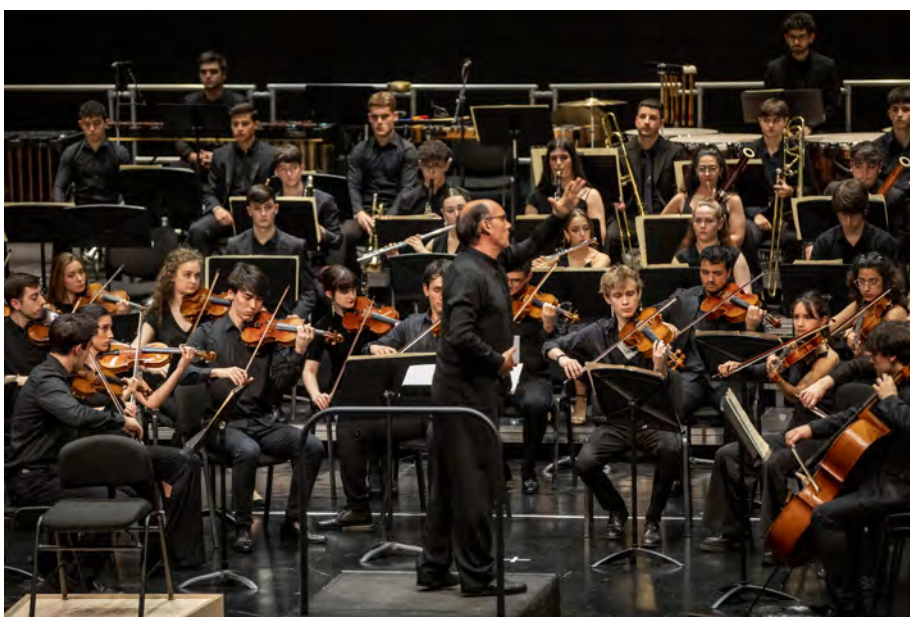
La Orquesta Sinfónica en el concierto del pasado 11 de mayo.