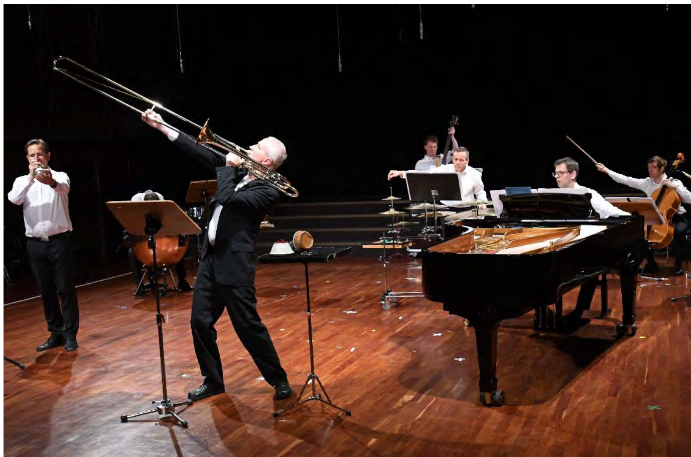
El prestigioso Ensemble Ascolta durante uno de sus conciertos.

Musikene acogió a finales de abril al prestigioso conjunto alemán Ensemble Ascolta. Durante tres días el alumnado de Creación e Interpretación de Máster trabajó con los músicos que lo forman en talleres y masterclasses, y todo el centro tuvo la oportunidad de conocerles de cerca. El público pudo, además, escucharles en un concierto el sábado 27 de abril en Musikene. El Ensemble Ascolta lleva desde 2003 enriqueciendo el panorama de la música contemporánea en Alemania y Europa con su sonido especial y sus inusuales proyectos. Ha inspirado y estrenado más de 250 obras. El conjunto ha actuado en los grandes festivales de música contemporánea y en conciertos en Estados Unidos, Singapur e Israel.