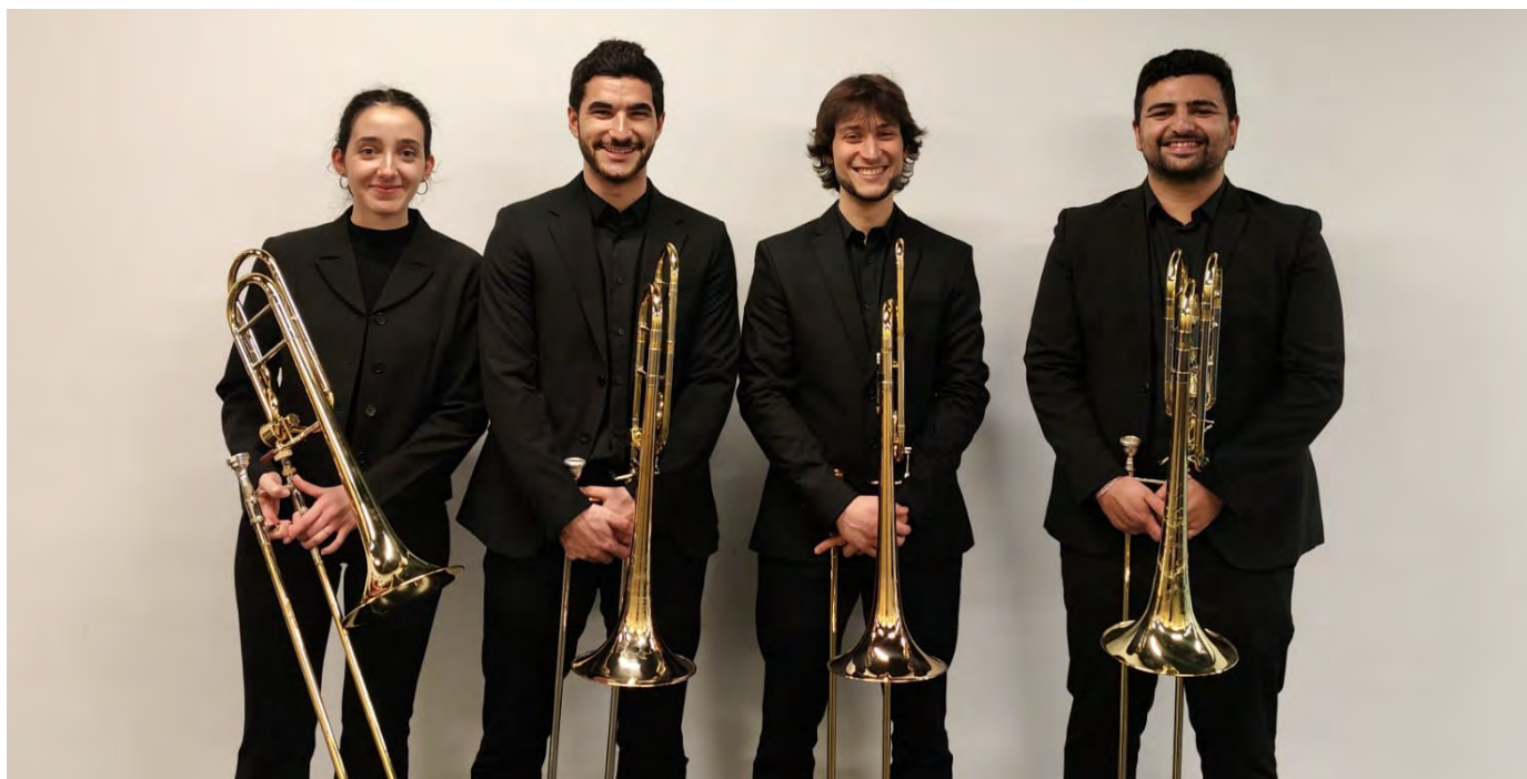
El cuarteto de trombones Euskandal abrió el ciclo de conciertos en Getxo.

En colaboración con la Getxoko Musika Eskola, se celebraron los pasados días 10 y 31 de mayo dos conciertos a cargo del alumnado de Máster. En el primero de ellos, el cuarteto de trombones Euskandal interpretó obras de Marini, Bozza, Vilaplana, Bourgeois y Sparke, además de una pieza de estreno de Galvéz Jiménez. Unas semanas más tarde, el trío de cañas Dánae nos hizo disfrutar con su interpretación de obras de Koechlin, de Faria y Martín.