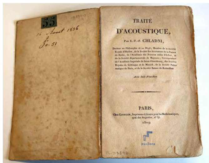
Libro más antiguo de la Mediateka, del año 1809.

- El sistema de clasificación de la Mediateka, utilizado para clasificar y ubicar todos los documentos en las estanterías, contiene 2.400 códigos posibles de aplicación.