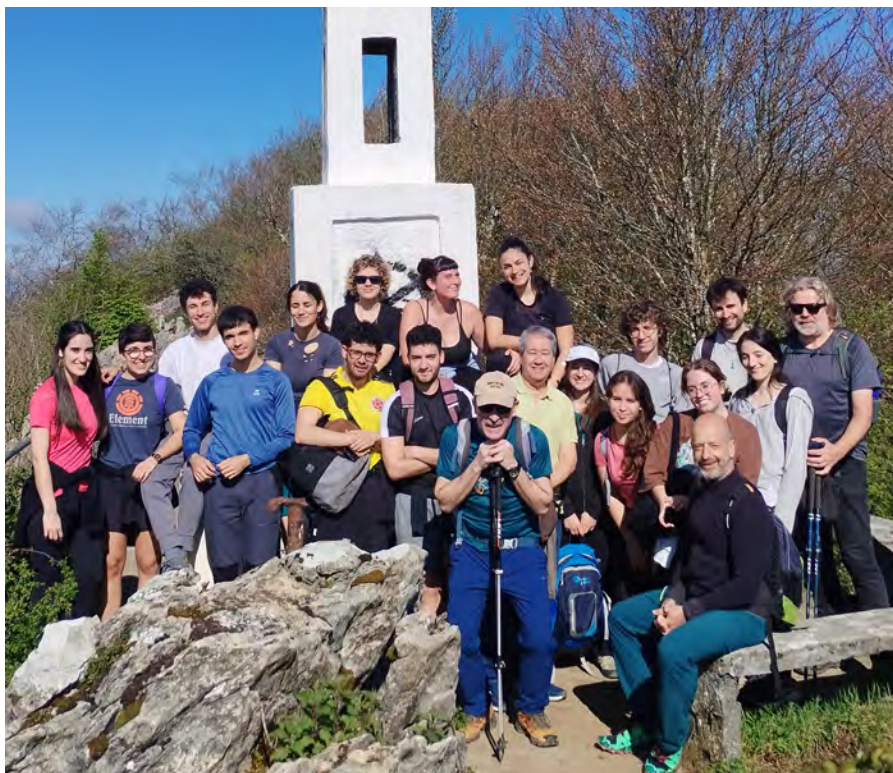
Los participantes disfrutaron de un día estupendo y de un hermoso paisaje.

Joan den ikasturtearen amaieran Musikeneko Jasangarritasun-Batzordea sortu zen, ikasleen, irakasleen eta AZLen ordezkariak osatua. Lehenengo bileretatik, Nazio Batuen Erakundeak adierazitako Ama Lurraren Nazioarteko Eguna ospatzeko ideia izan genuen (apirilaren 22an). Horretarako mendi ibilaldi bat antolatu genuen, naturarekiko eta ingurumen-kontzientziarekiko harremana sustatzeko asmoz, kirola aire zabalean egiteaz aparte. Horrela, apirilaren 20an (larunbata), Gipuzkoako bihotzera abiatu ginen autobus txiki batean adin eta espezialitate ezberdinetako 20 irakasle eta ikasle baino gehiago. Txango honek hobeto elkar ezagutzeko balio izan zigun. Gainera, Izarraitz mendigunean paisaia ikusgarriak ikusteko aukera izan genuen, bertatik Pirinioetako gailurrik altuenak, Gorbeia, Anbotoko mendilerroa eta ozeano atlantikoa 360°-ko panoramikoan ikusten baitziren. Astelehenean Musikeneko pasilloetan topo egin genuen berriro, batzuk agujetekin eta aurpegia apur bat erreta, baina aste berriari aurre egiteko energia berrituarekin. Eta zera ikasi genuen... gure planetaren eta bertan bizi garen guztion osasuna gure ekosistemen osasunaren mende dagoela. Zaindu dezagun!