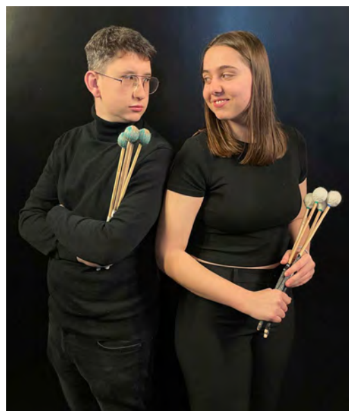
Roll Duo actuó el 9 de mayo.