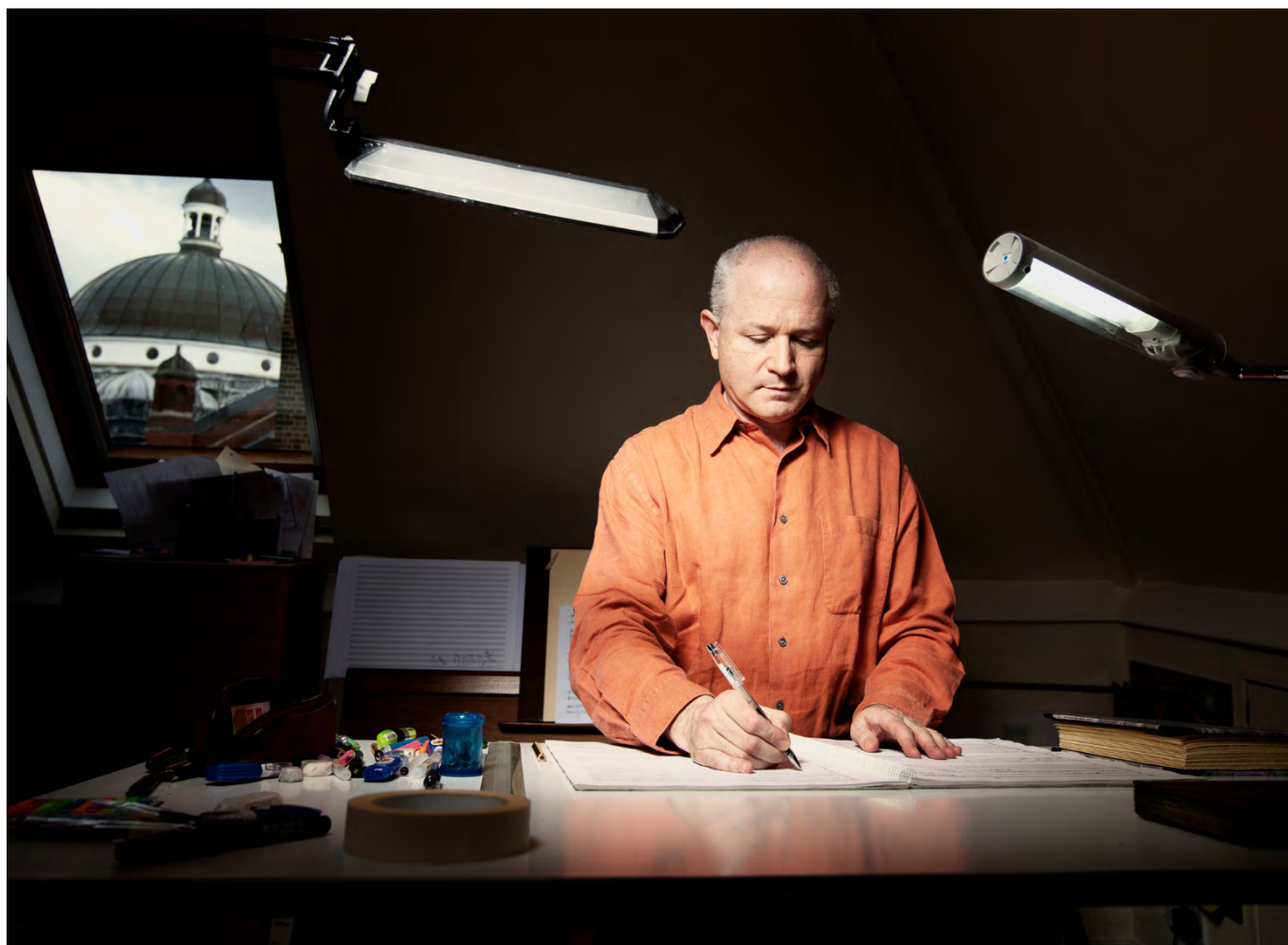
El compositor londinense en un momento de creación.

Entre el 8 y el 11 de mayo Musikene acogió al compositor británico George Benjamin, galardonado con el Premio Fronteras del Conocimiento concedido por la Fundación BBVA. El creador impartió el taller de composición, además de masterclasses para el alumnado del centro y un concierto de piano, protagonizado por los alumnos y el profesor de la especialidad, en el que el público pudo acercarse a la originalidad de su obra. En el concierto pudimos escuchar Piano Figures, Meditation on Haydn's name (3 Studies, No. 2), Shadowlines y Sortilèges. Como prelude al concierto de la Orquesta Sinfónica de Musikene, dirigida por Franck Ollu y que contó con la intervención de Maria Slascheva como solista, se celebró una mesa redonda en torno al maestro londinense. La visita de Benjamin se enmarca dentro del ciclo Acércate a los grandes compositores que Musikene inició con el apoyo de la capitalidad cultural DSS2016 para acercar al público los creadores más importantes de las últimas décadas de una forma completa, lúdica y amena. El ciclo comenzó con la visita del compositor alemán Helmut Lachenmann en 2016 y ha continuado con figuras de renombre internacional como Peter Eötvös, Pascal Dusapin, Kaija Saariaho y Toshio Hosokawa.