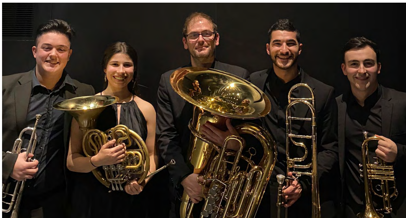
El quinteto Abracadabrax actuó el 17 de abril en Trintxerpe.