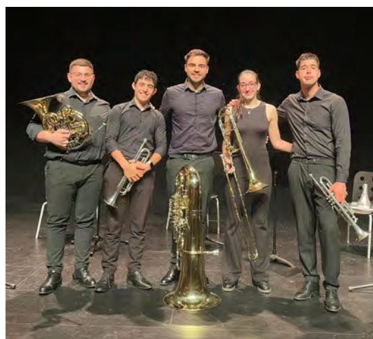
Master Brass Quintet actuó en Tolosa.

III. Maiatzeko doinuak zikloa osatu dute masterreko lau ganbera talde ezberdinek Tolosako Topic museoan, maiatzeko igandeetako eguerdiko 12:00etan. Lehen emanaldia zeharkako txirula eta harpadun Duo Carmesik egin zuen. Hurrengo asteburuan, Fluctus Quartet hari laukoteak egin zuen emanaldia; ondorengoak Boreas Wind Quintet haizezko instrumentistak izan ziren eta Master Brass Quintet metalezko instrumentuen taldeak eman zion bukaera doinuen ibilbideari.