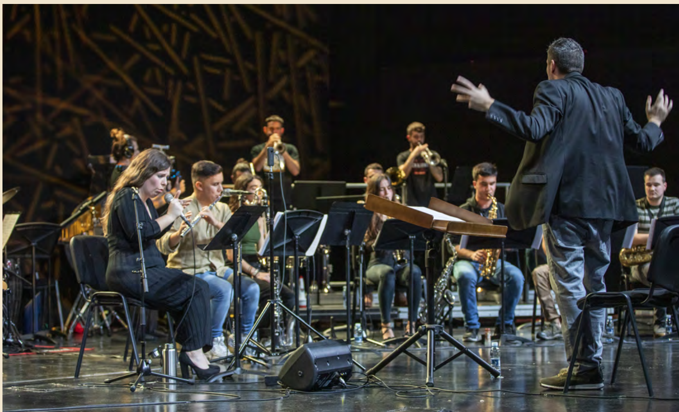
La Big Band de Musikene en su concierto del pasado 10 de noviembre.

- Es una obra de una dificultad técnica, tímbrica, musical y sonora importante. No es un lenguaje tradicional o al uso para Big Band. Es mi sonido compositivo adaptado a esta instrumentación y a esta generación de músicos de jazz fascinantes que tenéis en Musikene.