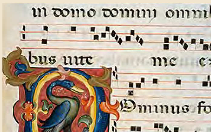
Fragmento de un Canto Gregoriano.

Musikenek eta Eresbil-Euskal Musikaren Artxiboak Teloiaren atzean. Musikaren ezkutuko lanbideak jardunaldia antolatu zuten joan den urrian Musikenen. Jarduera musika-dokumentazioarekin lotutako ofizioen errepaso egin zen; izan ere, prozesu zabal baten parte dira, eskuizkribu baten lokalizazioa eta katalogazioa edo inbentarioa egitetik hasi eta transkripzio, edizio eta interpretaziora arte. Musika klasikoko eta modernoko hainbat adituk gako esanguratsuak eman zizkiguten solasaldi atseginen bidez.