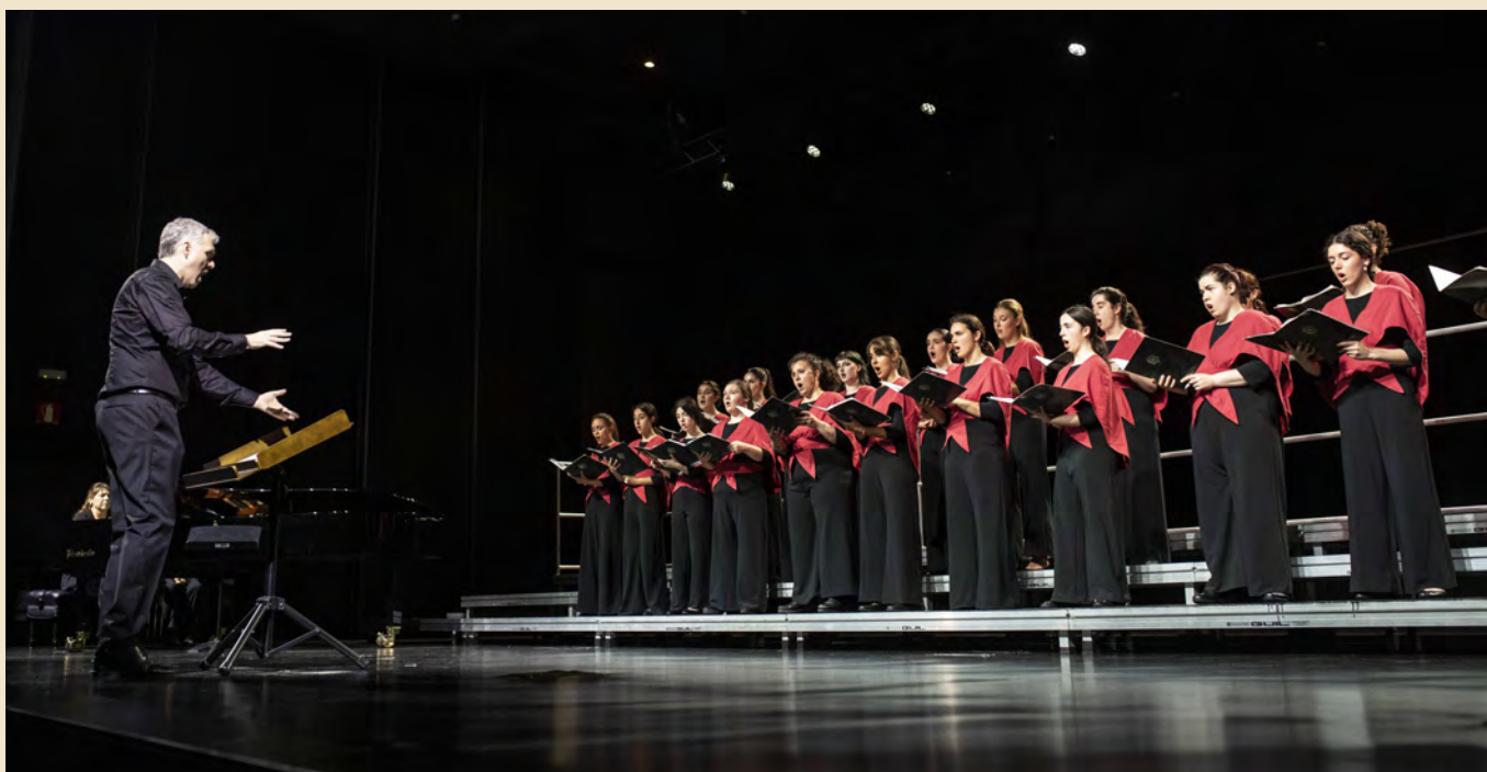
Concierto a cargo de los coros de la Escuela de Música de Andoain y San Pedro Abesbatza de Zumaia

Musikene acogió el 7 de octubre una jornada sobre el mundo coral en el País Vasco, organizada por su programa Erasmus+ y en colaboración con la Confederación de Coros de Euskadi. El encuentro comenzó con una charla que dio a conocer la situación actual del sector coral juvenil e infantil del País Vasco. A continuación, se presentó el proyecto IN-VOICE 4MPOWERMENT, que busca incluir a la juventud utilizando pedagogías corales innovadoras y tecnologías digitales. Posteriormente, se llevó a cabo un ensayo abierto al público de un coro formado por los propios integrantes de la ponencia. Para finalizar, los participantes hablaron sobre el informe expuesto por la Confederación de Coros del País Vasco. Las agrupaciones de la Escuela de Música de Andoain y San Pedro Abesbatza de Zumaia pusieron el broche de oro con un concierto de arreglos de melodías populares vascas con acompañamiento pianístico.