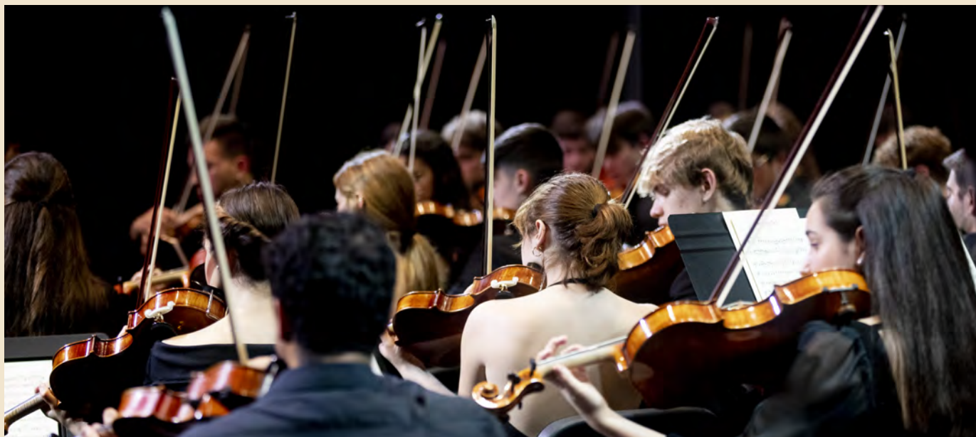
Orkestra ikasketetako taldeak ikastetxeko ikasleez osatuta daude.