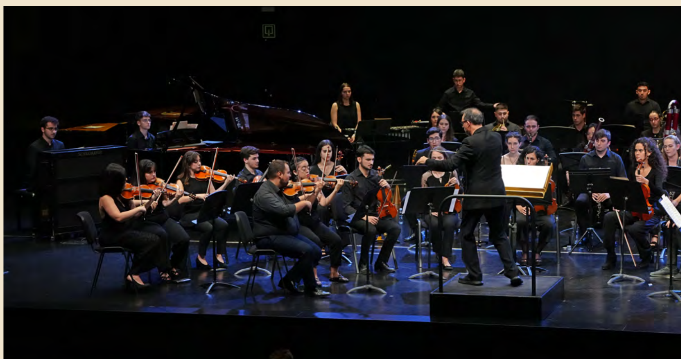
MSKN Master Ensemble interpretando Schreker.

El pasado mes de octubre tuvo lugar en Musikene el primer encuentro del MSKN Master Ensemble, una agrupación formada por el alumnado del Máster de Interpretación que dirige José Luis Estellés. Dicho conjunto se centra en interpretar música de los siglos XX y XIX, abarcando numerosos estilos y géneros. El concierto comenzó con Kleine Suite für Orchester de F. Schreker, siendo la obra de mayor instrumentación. A continuación, actuó la mezzosoprano Leticia Vergara como solista en Parole di San Paolo per una voce media e alcuni strumenti de L. Dallapiccola. El novedoso concierto, finalizó con Appalachian spring de A. Copland.