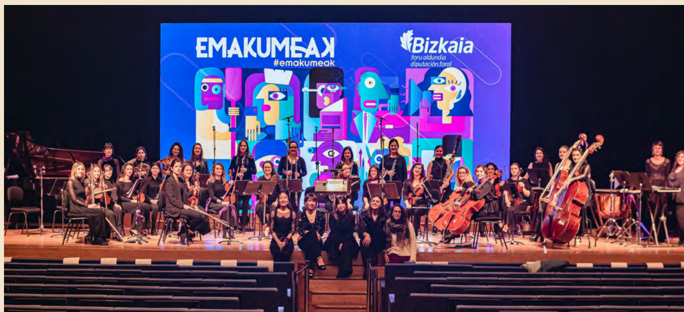
Las responsables de ESAS posan al término de uno de sus conciertos.

Como Musikene alumni, nos sentimos muy identificadas con el alumnado y queremos respaldar a la comunidad educativa. ESAS y Musikene compartimos una creencia fundamental: el arte y la cultura son fuerzas poderosas para el cambio social y la construcción de una sociedad más equitativa y sensible. Estamos comprometidas a colaborar y co-crear proyectos que reflejen esta visión compartida y contribuyan a nuestras respectivas misiones, incluyendo el compromiso con la igualdad y la justicia de género a través del arte y la cultura. Nuestro Premio ESAS-Musikene tiene como objetivo promover la investigación, incentivar la inclusión de la perspectiva de género en el ámbito académico y reconocer los mejores trabajos de fin de grado con temática feminista. Este premio anual no tiene una dotación económica, pero viene acompañado de una lámina numerada de tirada única realizada por Inge Conde, compositora y artista plástica. Además, ESAS puede proponer al alumnado premiado la presentación de su trabajo en distintos entornos académicos y la divulgación del mismo en nuestros canales de difusión. Queremos que vuestros trabajos sean útiles para vosotras/os y para la sociedad.