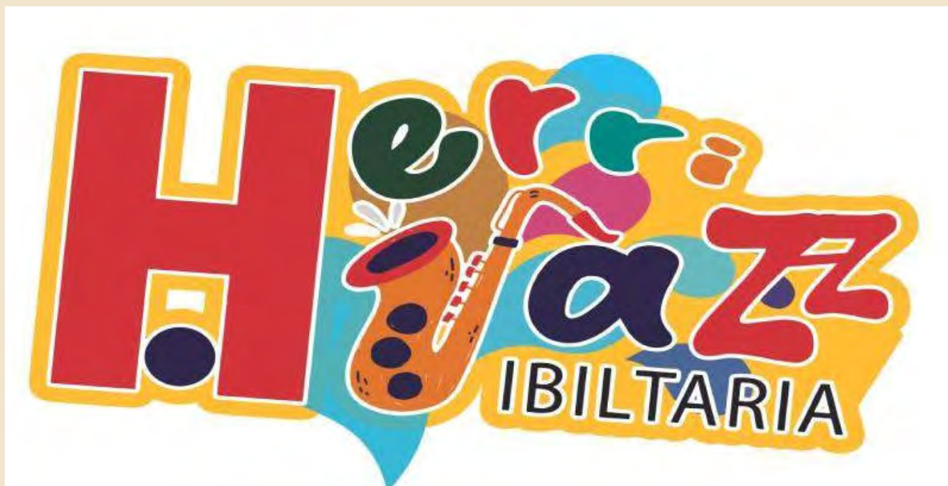
Kontzertuko zikloaren irudia.