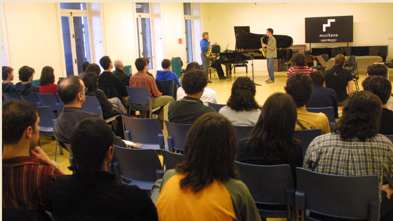
Foto del aula Charles Linale del Palacio Miramar, habilitada para la docencia y las masterclasses.

Sufrimos algunas pérdidas crueles, como lo fue a poco tiempo de nuestro comienzo la de Charles-André Linale, gran violinista y maestro de cuartetos de cuerda, cuyo nombre fue puesto al aula 105 de nuestro primer Musikene, el que se estableció en el hermoso Palacio Miramar. Fueron realizados en él muchos trabajos de adecuación para el nuevo centro de música.