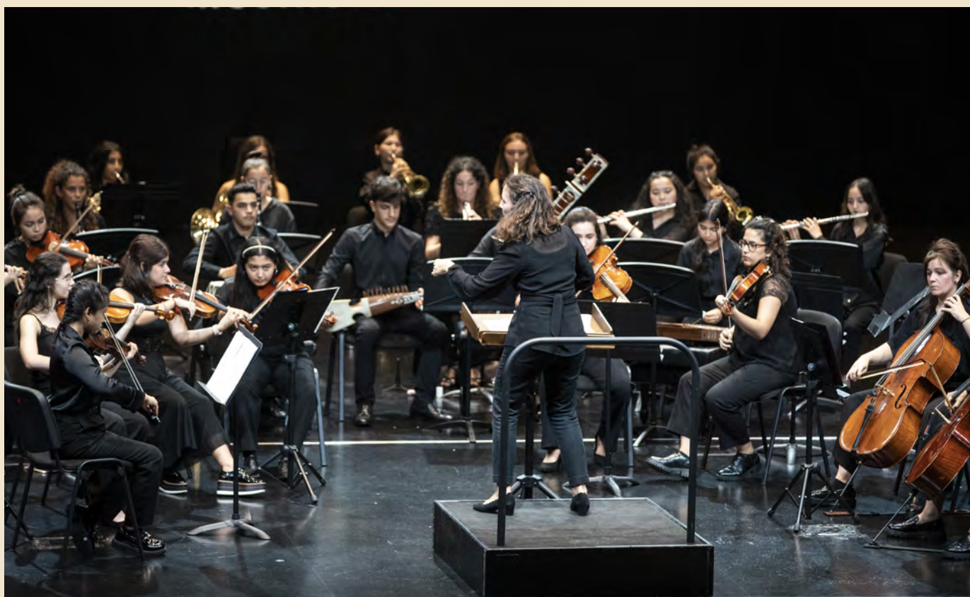
Zohra Orkestra Musikeneko ikaslegoarekin elkarlanean.