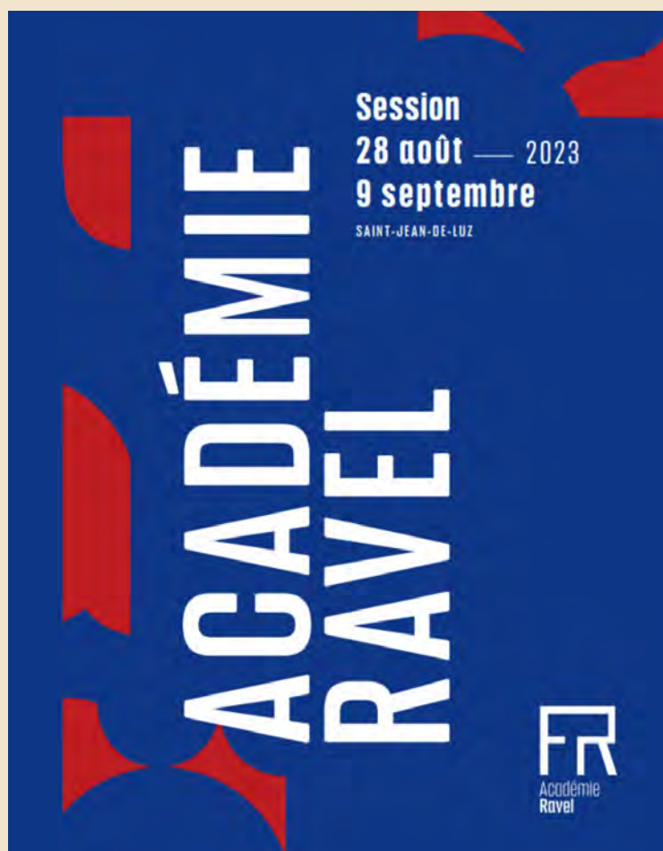
Cartel de la Academia Ravel en su edición de 2023.

Musikene acogió en su auditorio el concierto de clausura de la II edición del Curso de Interpretación y Composición de la Academia Ravel el pasado mes de septiembre. El festival, que se celebró en San Juan de Luz entre el 23 de agosto y el 9 de septiembre, contó con artistas como Bernarda Fink, Michel Béroff y Miguel da Silva, entre muchos otros, con el objetivo de aportar formación y experiencia a las jóvenes generaciones de músicos con conferencias, clases magistrales y conciertos. El nutrido programa de actividades se completó con el ya citado encuentro de clausura en nuestro centro. En él, varios jóvenes instrumentistas junto a estudiantes de Musikene, interpretaron obras compuestas por alumnos como Balada de Leonel Aldino, Nachtstrahlen de Ben Pease Barton, Die yk-suttke de Christiaan Willemse, Schwerer werden leichter sein de Joey Tan y Parole Sparse II de Seong-Hwan Lee, todos ellos dirigidos por los compositores Michael Jarrell y Ramon Lazkano.