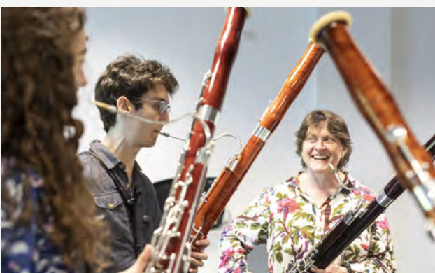
El alumnado de Musikene en una masterclass.

Klangforum Wien, integrado por 24 músicos de 12 países, explora constantemente nuevos horizontes de creatividad artística junto a los compositores más importantes de nuestro tiempo. De mente abierta, virtuosos en la interpretación y perceptivos auditivamente, se dedican a la interpretación artística y a la expansión del espacio experiencial. Una actuación del Klangforum Wien es un acontecimiento en el mejor sentido de la palabra; ofrece una experiencia sensual, inmediata e ineludible.