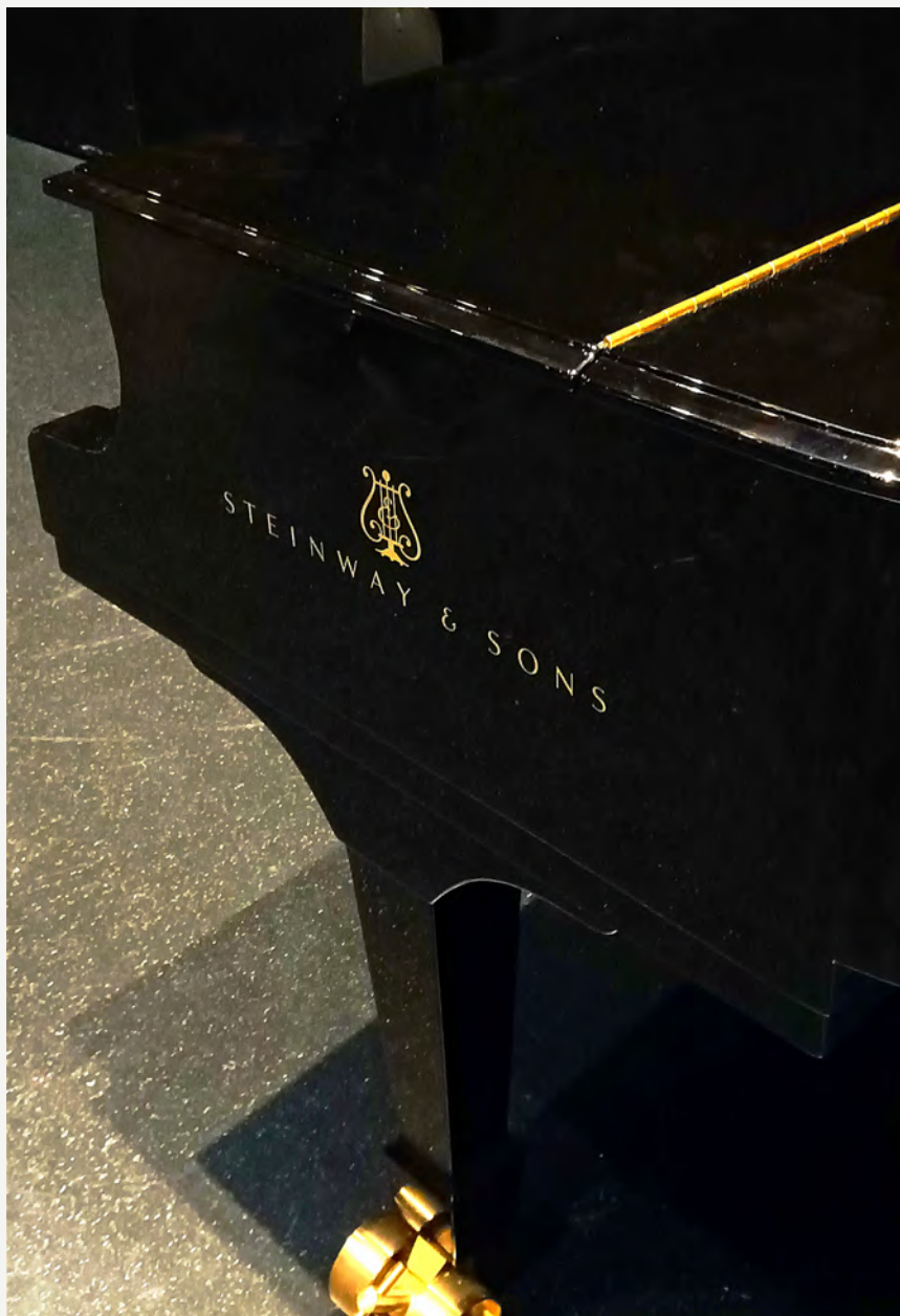
Detalle del nuevo piano Steinway and Sons del Auditorio.

Musikeneren sorreratik instrumentuak berritu gabe zeuden