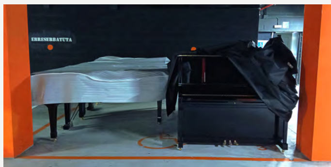
Los pianos antiguos situados en el garaje de Musikene.

Goi mailako ikasketek lehen mailako pianoak behar dituzte