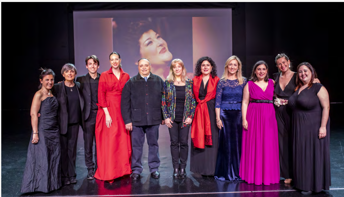
Todos los participantes posando tras el concierto.