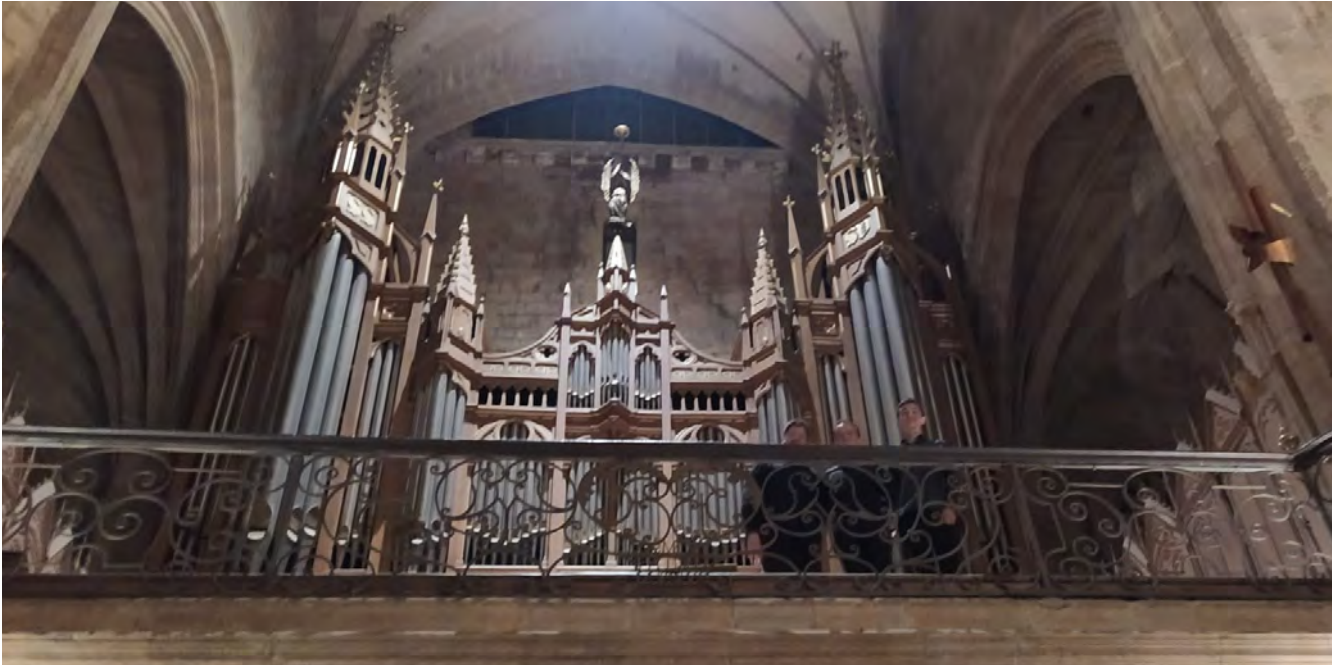
San Vicente elizaren organoa.