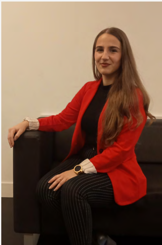
CAROLINA LUQUIN, soprano.