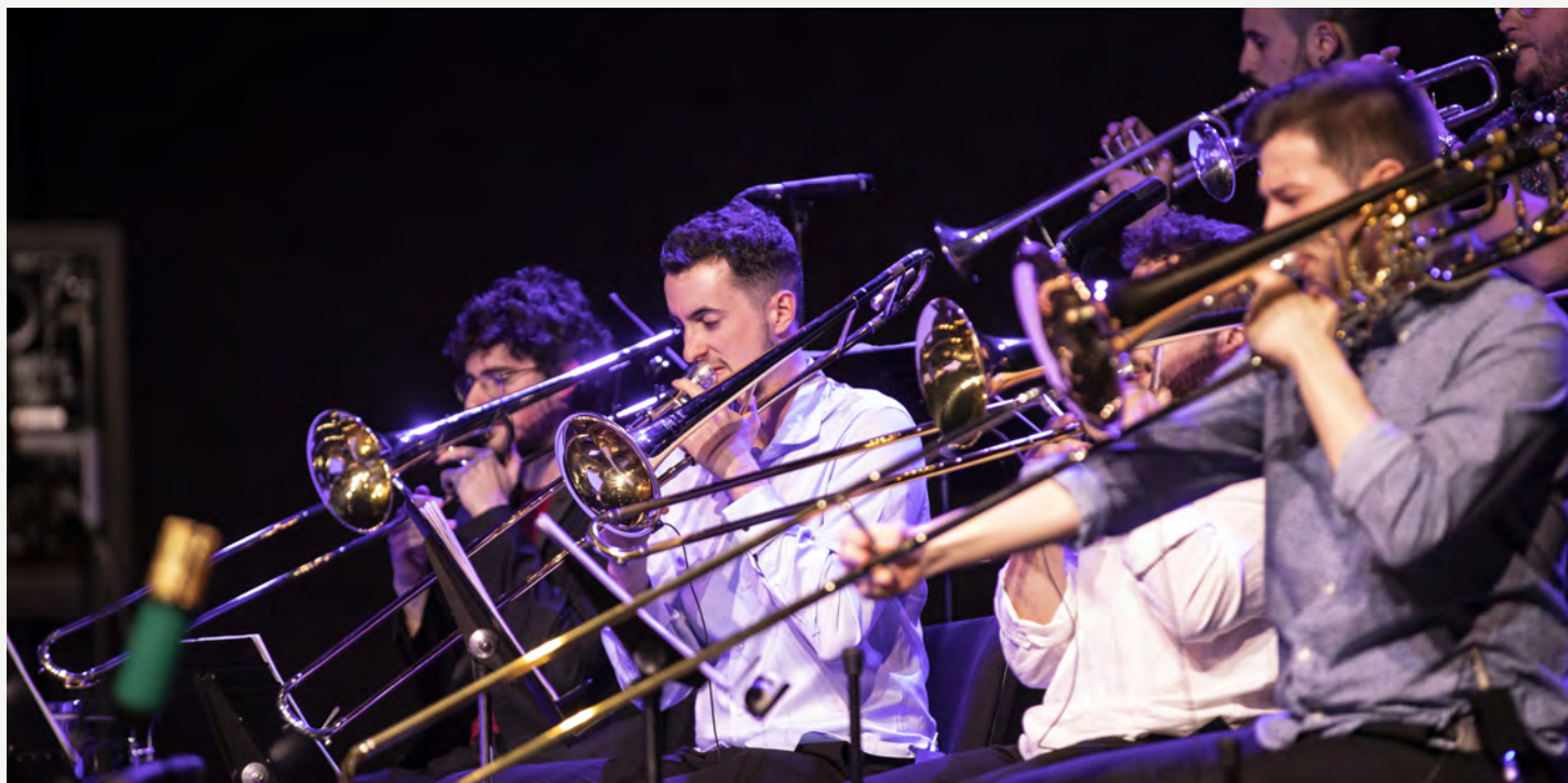
La Big Band durante el concierto de febrero en Musikene.