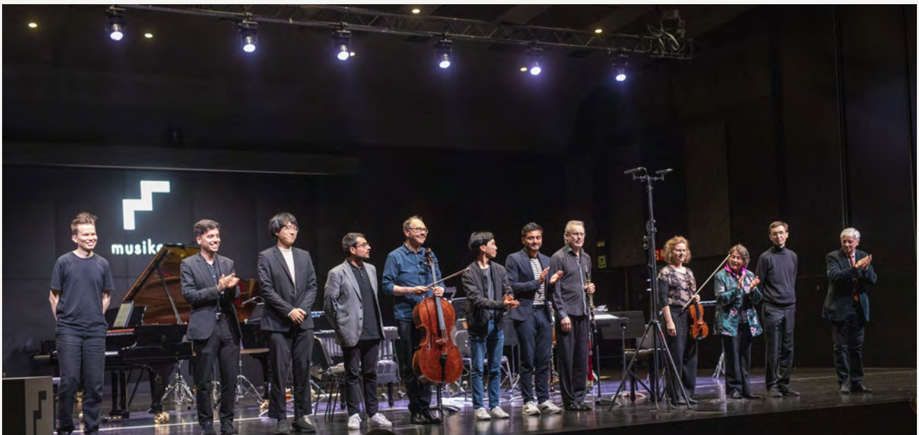
La Klangforum Wien agradecida ante el público.