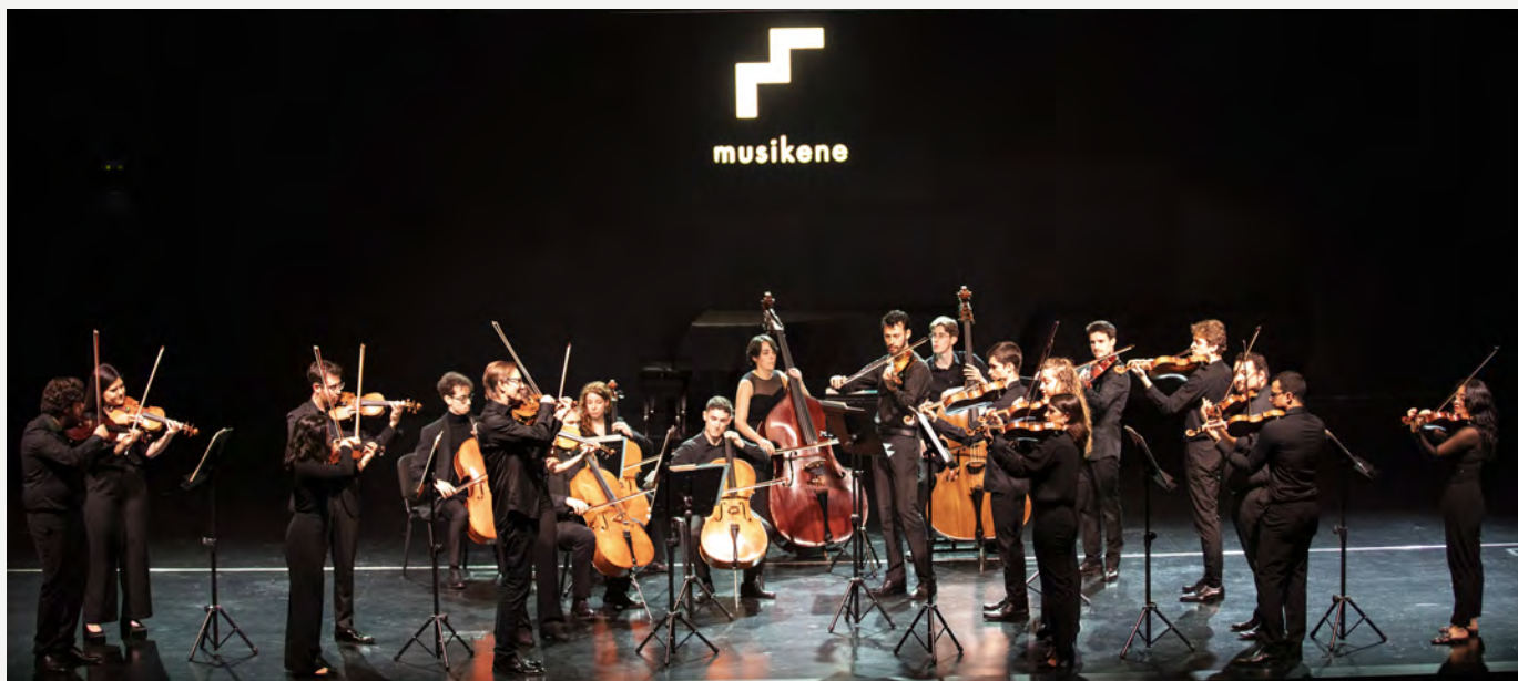
La Master String Orkestra en el Auditorio de Musikene.

Por otra parte, la Musikene Master String Orkestra, agrupación formada por el alumnado que cursa el Máster de Estudios Orquestales en Musikene, ofreció el 18 de febrero, un concierto en el auditorium de Musikene. El encuentro es el resultado del trabajo realizado durante toda la semana bajo la dirección del violinista sueco Mats Zetterqvist. El concierto se abrió con Apollon Musagète de Stravinsky y la segunda parte estuvo dedicada a Dvořák, con su Serenade for Strings Op.22. Un concierto más que entretenido.