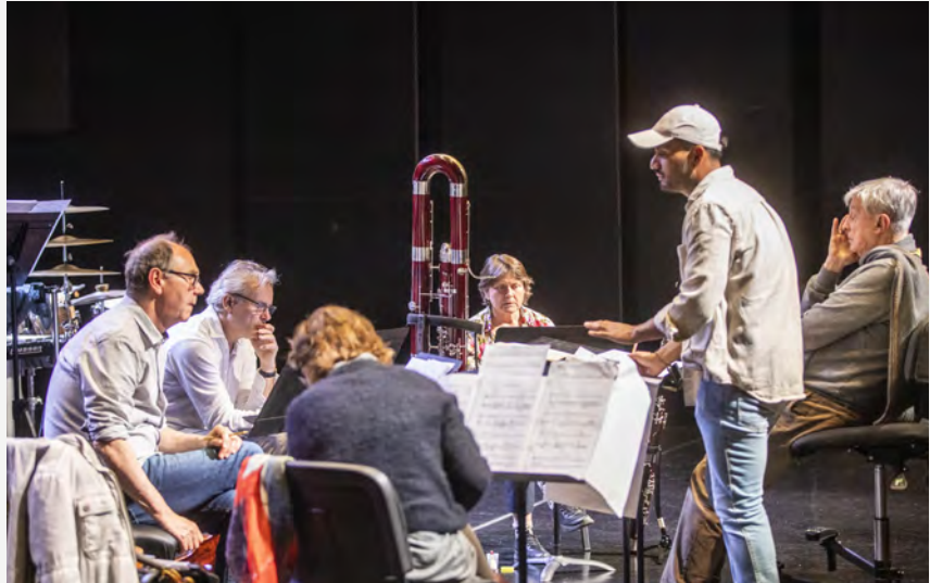
Durante los ensayos previos al concierto.

El prestigioso ensemble de Viena, Klangforum Wien, realizó una residencia en Musikene los días 27, 28 y 29 de abril, gracias a la cual el alumnado de Creación e Interpretación de Máster pudo trabajar con ellos en talleres y masterclasses. Además, todo el centro tuvo la oportunidad de conocerles de cerca. El público pudo escucharles en un concierto el pasado sábado 29 de abril en el auditorio de Musikene.