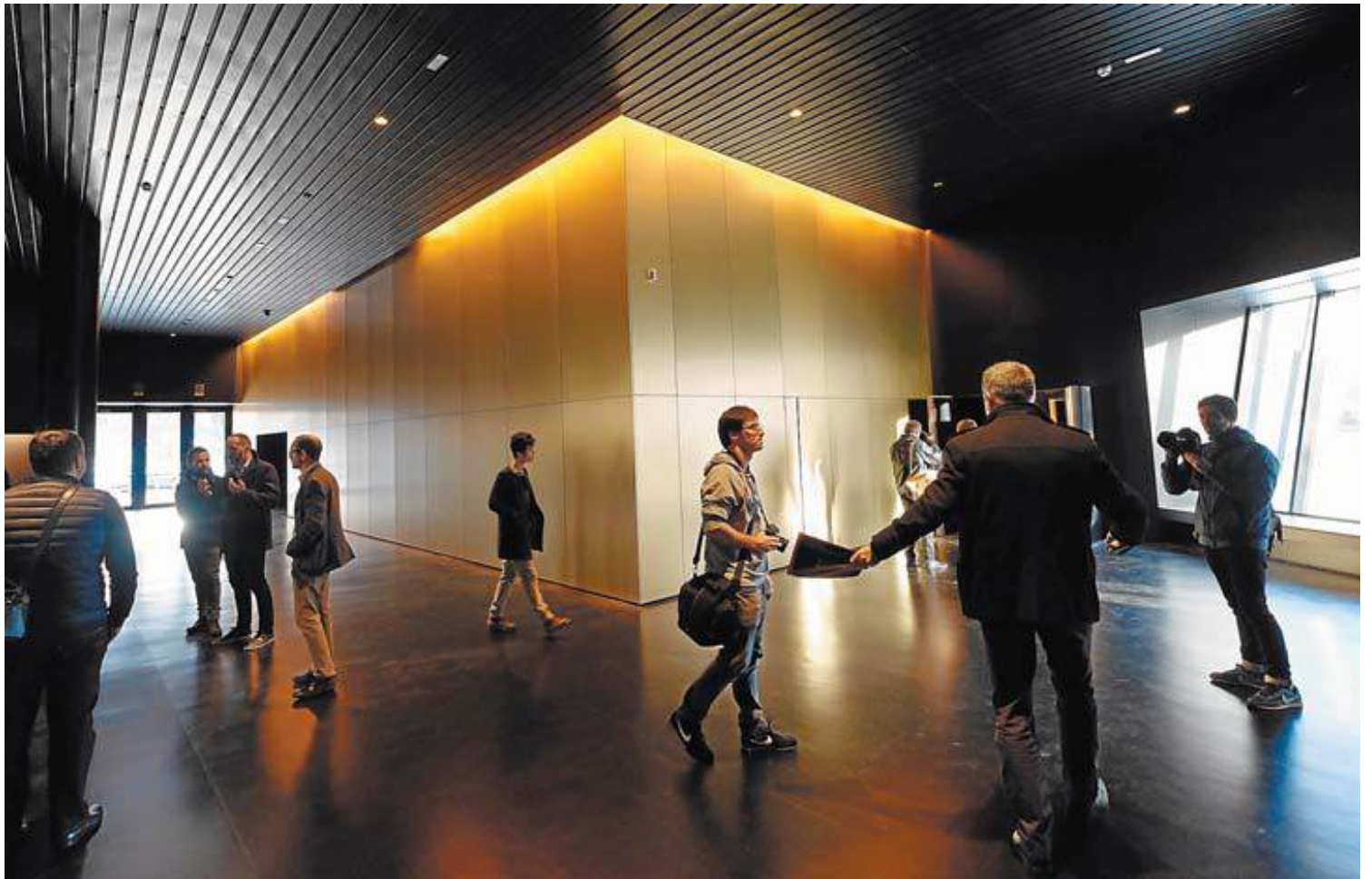
El vestíbulo de la planta baja del nuevo edificio de Musikene, con el auditorio, recubierto de chapa dorada, al fondo.