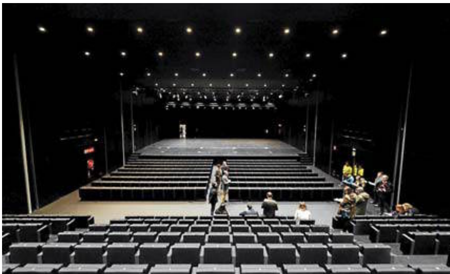
El auditorio, con capacidad para 420 personas y con un escenario pensado para acoger a doscientos músicos.