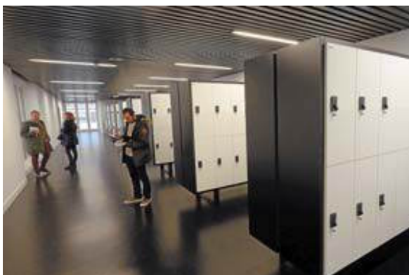
La tercera y cuarta planta albergan sendos espacios de taquillas.